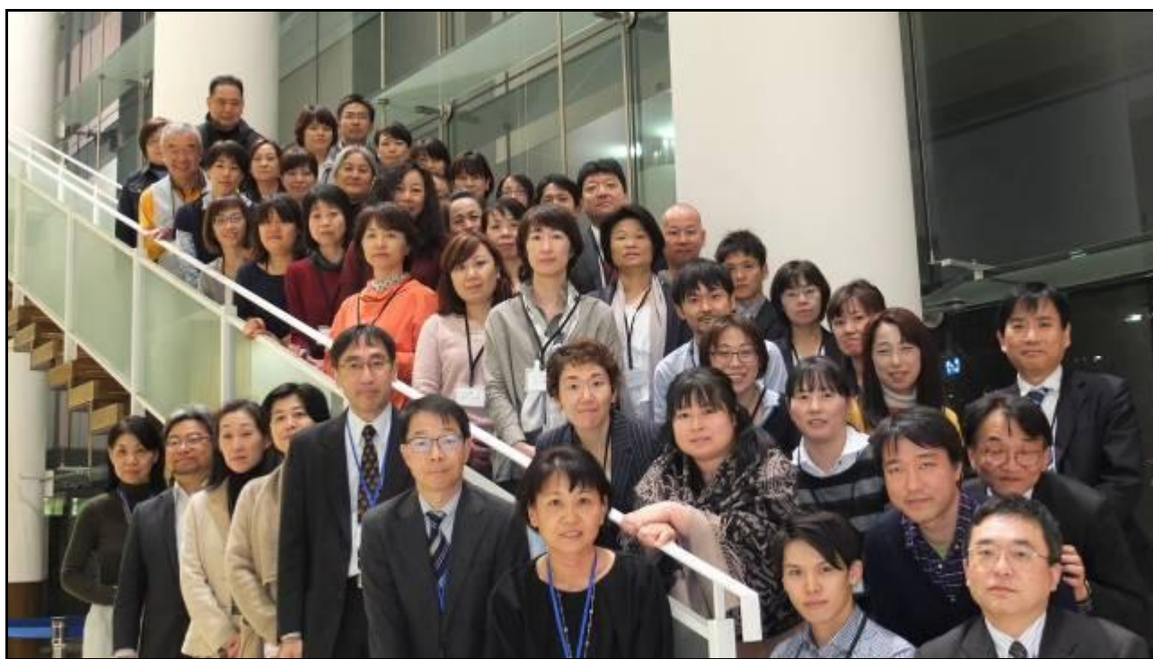
トレーニングコース指導者と受講者の皆さん