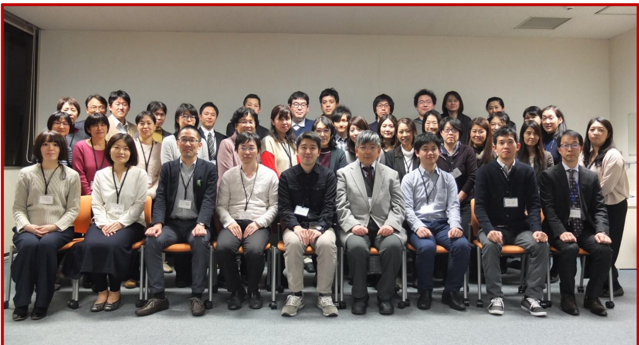
トレーニングコース指導者と受講者の皆さん