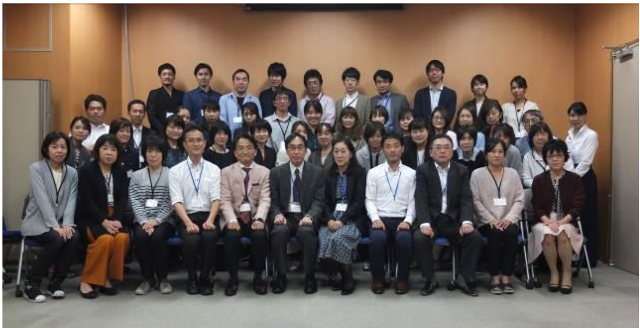
トレーニングコース担当講師と受講者の皆さん